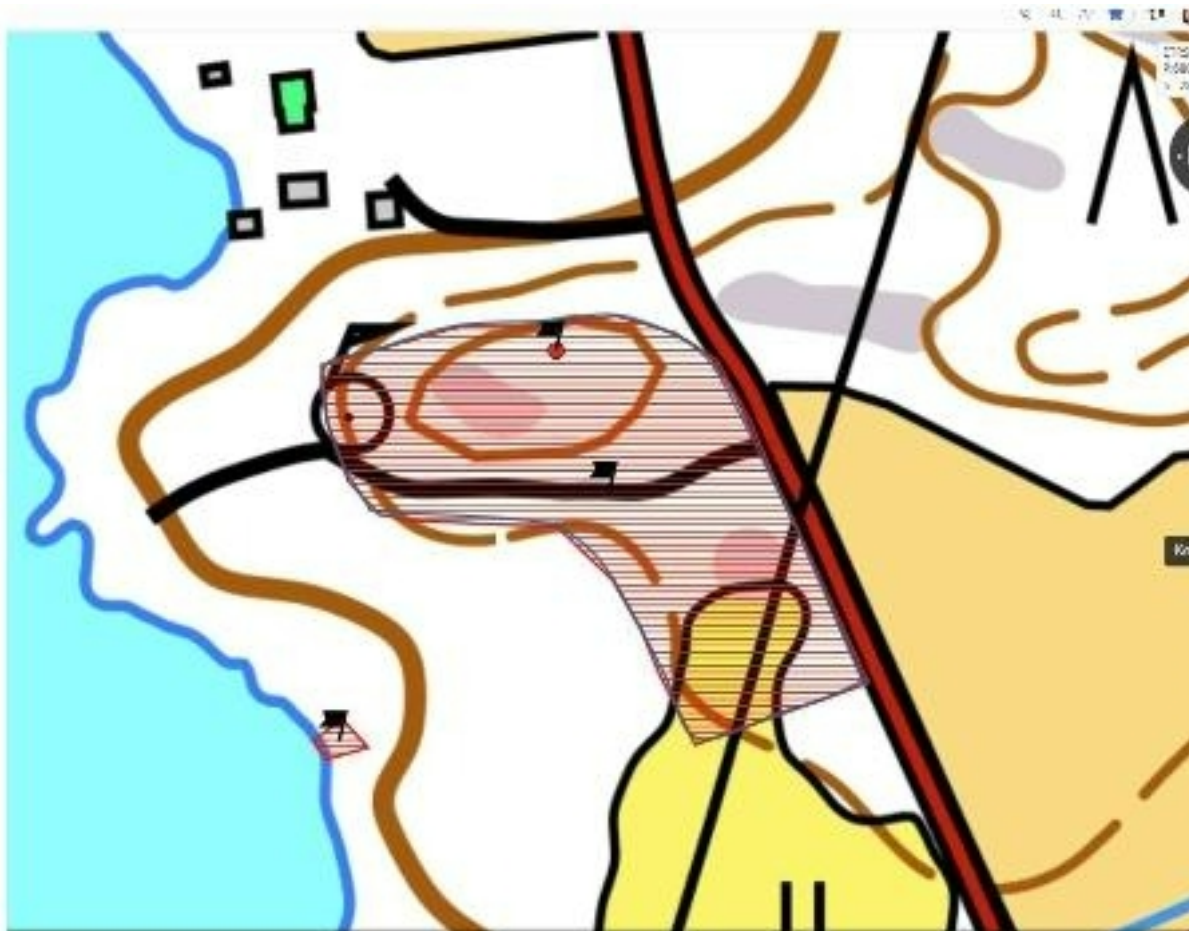
Kartta: Maanmittauslaitos. Museovirasto. Muinaisjännöksen sijainti on merkitty punaisella rasterilla ja hoitoalue sinisellä viivalla.